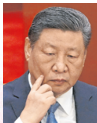
Xi droht, Taiwan notfalls mit Gewalt zu unterwerfen.

auch wenn keine Schüsse fallen. Waffenstarrende Großmächte schüchtern Kleinere ein. Das Prinzip der Abschreckung ist zurück: Politiker werben für Kriegsvorbereitungen, um den Frieden zu erhalten.