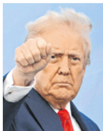
Trump ignoriert völkerrechtliche Grenzen.